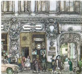
Petrovka Street (19x18) 1989

Born in Moscow January 1, 1952. Graduated from the Textile Academy Department of Design. Studied in the Art Academy under O. Venetskiy. Participant of numerous exhibitions in Russia and abroad. Works can be found in the Tretyakov Gallery, Museum of L. Tolstoy, State Historical Museum and others.