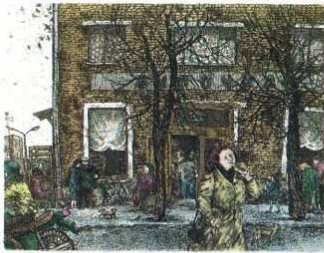
Bakery (19x14) 1992