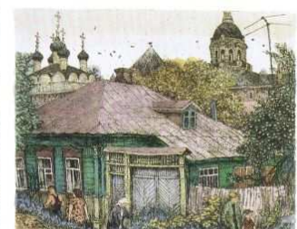
House with three windows (19x16) 1992