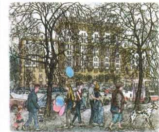
Spring at Novosilki Boulevard (20x17) 1995