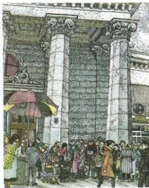
At Metro «Kosmonobkaya» (20x25) 1997