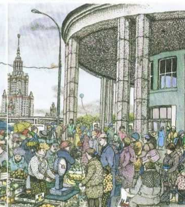
Moscow. City is trading. Metro «Universität» (26x20) 1997