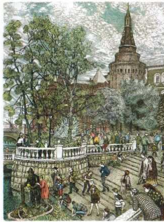
«Golden Grandpa» on Marsh Square (29x35) 1997