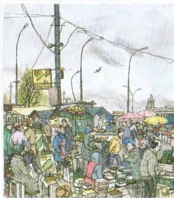
Das handelnde Moskau bei der U-Bahnstation «Universität» (26x20) 1997