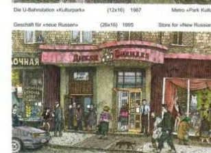
Store for «New Russians» (26x16) 1995